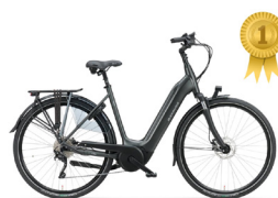
Eerste plaats BATAVUS Finez E-go Power Sport

De Batavus valt in de smaak omwille van zijn comfortabele rijkwaliteiten en uitstekende wendbaarheid. Ook de innovatieve verlichting met automatisch groot licht en laser-beam achterlicht bleven niet onopgemerkt door de jury!