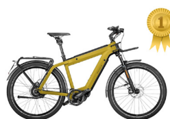
Eerste plaats RIESE & MÜLLER Supercharger2 GT vario HS

Riese & Müller veroverde dit jaar het hoogste schavot omwille van zijn algemene rijkwaliteiten. De Supercharger2 GT vario HS is en blijft een een rasechte kilometerreter van het hoogste niveau.