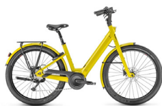
Tweede plaats MOUSTACHE Lundi 27.3

De Batavus valt in de smaak omwille van zijn comfortabele rijkwaliteiten en uitstekende wendbaarheid. Ook de innovatieve verlichting met automatisch groot licht en laser-beam achterlicht bleven niet onopgemerkt door de jury!