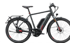
Eervolle vermelding KOGA Pace B20

De Sparta haalde over de gehele lijn erg hoge scores. De D-BURST METb SPEED is een echte eye-catcher en is op vlak van connectiviteit volledig mee met de tijd.