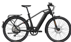
Tweede plaats FLYER Upstreet6

Riese & Müller veroverde dit jaar het hoogste schavot omwille van zijn algemene rijkwaliteiten. De Supercharger2 GT vario HS is en blijft een een rasechte kilometerreter van het hoogste niveau.