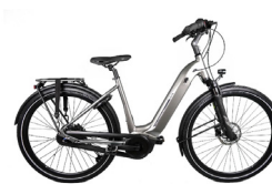
Eervolle vermelding SUPERIOR SBC 400i

De Stella is een zeer moderne fiets met een opvallend goede prijs/kwaliteitverhouding. De fiets wordt onder meer geprezen omwille van zijn geruisloze riemaandrijving in combinatie met de automatische naafversnellingen.