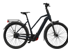
Derde plaats STELLA Morena Premium MDB FI

De comfortabele rechte zithouding van de Moustache charmeert de jury, vanaf de eerste meter geeft de fiets een gevoel van vertrouwen. De mooi weggewerkte bekabeling wordt eveneens gewaardeerd.