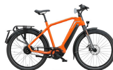
Derde plaats SPARTA d-BURST METb Speed

Flyer bekoort de jury met de nieuwe krachtige motor in het achterwiel en het mooie in de stuurpen geïntegreerde display. De Upstreet 6 HS scoorde ook erg hoog omwille van de goede prijs/kwaliteitsverhouding.